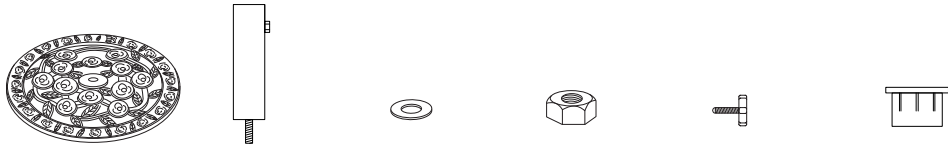
A.ベース：1枚 B.ポール：1本 C.ワッシャー：1枚 D.ナット：1個 E.固定ボルト：1本 F.アダプター：1個