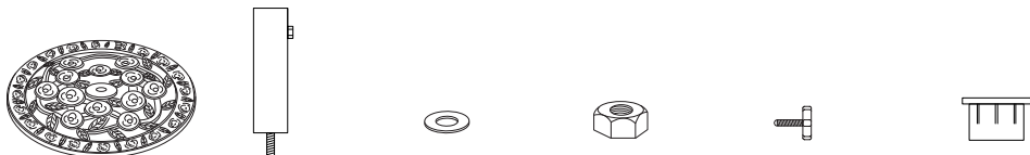
A.ベース：1枚 B.ポール：1本 C.ワッシャー：1枚 D.ナット：1個 E.固定ボルト：1本 F.アダプター：1個